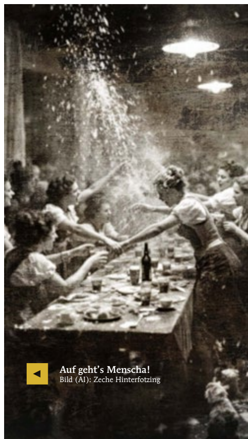
◀ Auf geht's Menscha!

*Ziaga: Sauftour, das Prinzip lautet: Jede hat dafür zu sorgen, dass es bei uns am lustigsten ist!