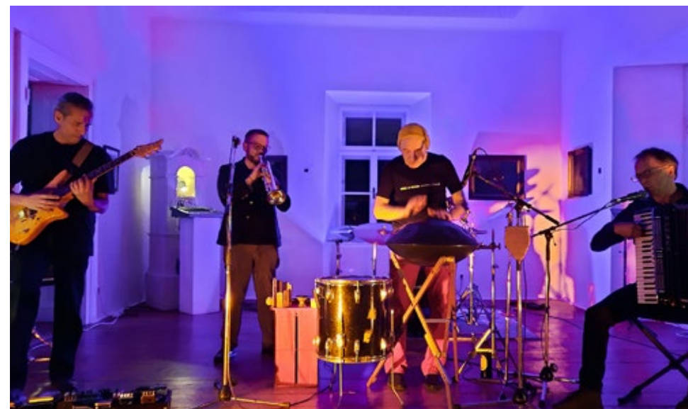
▼ Concert Surprise