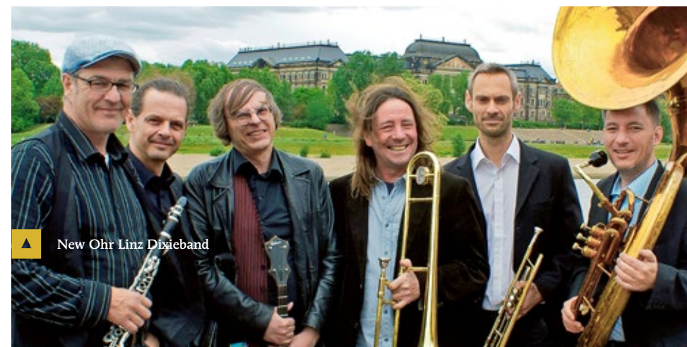
▲ New Ohr Linz Dixieband

Einlass: 18:30, Beginn 19:30 Uhr. Eine Veranstaltung von „Kultur im Dorf“ im Rahmen des Innviertler Biermärz.