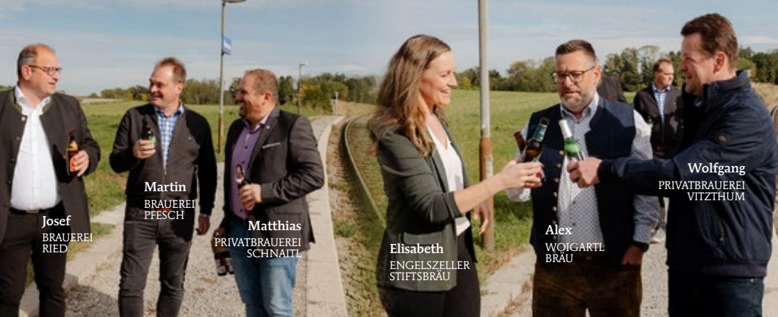
Josef BRAUEREI RIED