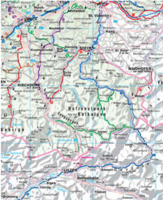
Ausschnitt aus der Kompass-Autokarte 309 Österreich, Lizenznummer