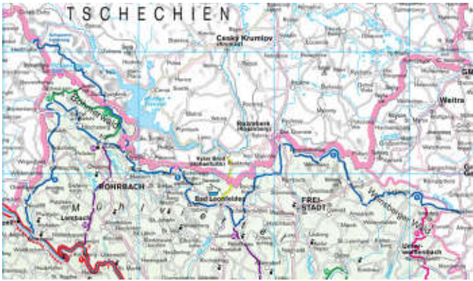
Ausschnitt aus der Kompass-Autokarte 309 Österreich,