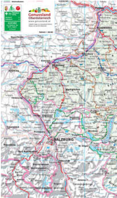
Ausschnitt aus der Kompass-Autokarte 309 Österreich, Lizenznummer 7-0704-L