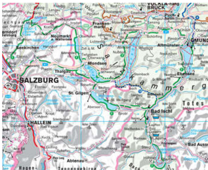
Ausschnitt aus der Kompass-Autokarte 309 Österreich,