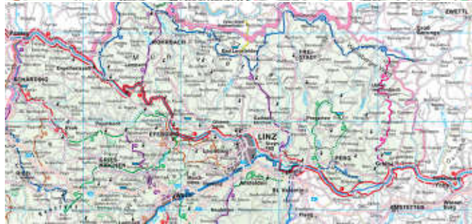
Ausschnitt aus der KOMPASS-Autokarte 309 Österreich,